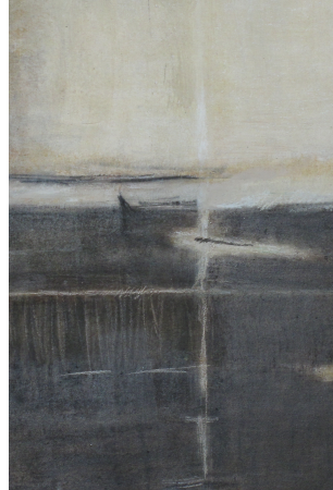
PAULE TAVERA SORIA