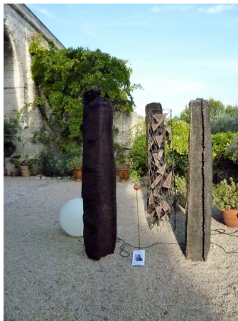
ODILE DE FRAYSSINET