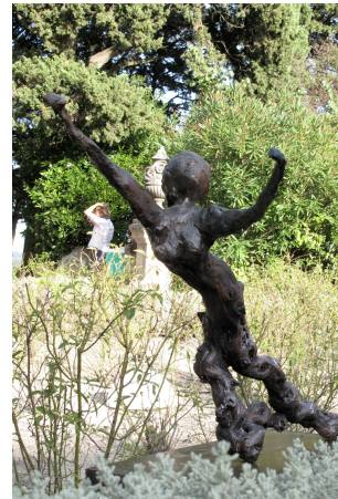
KARINE DE BORDAS